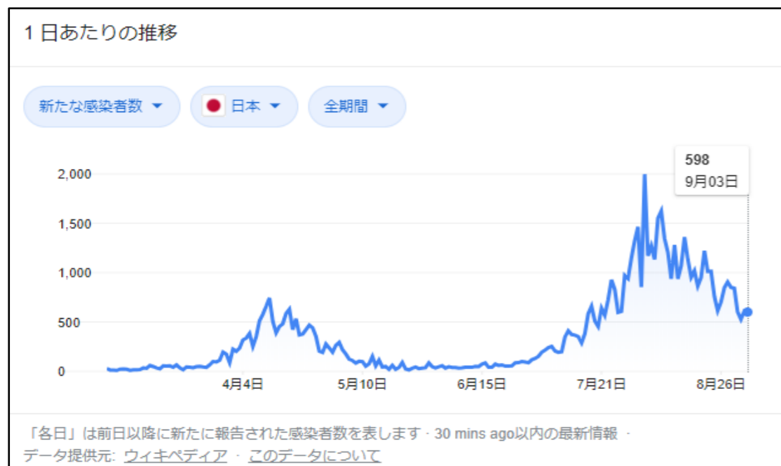
図1. 9月3日までの感染者数推移（Googleより）

●コロナ専門家会合「感染者 緩やかな減少傾向続くも警戒必要」 https://www3.nhk.or.jp/news/html/20200902/k10012597311000.html